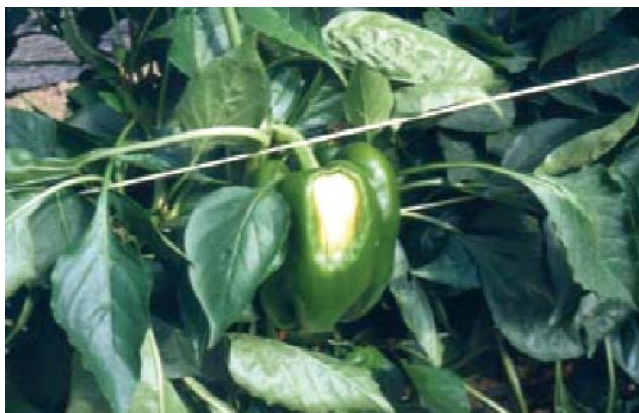
Golpe de sol

Las variedades tipo Lamuyo y California se comercializan rojas y verdes. Por lo general no se comercializan frutos rojos totales sino con porcentajes del 50 y 75% (entreverados). La extracción del fruto debe hacerse siempre con tijera.