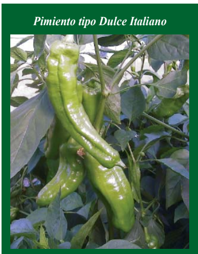
Pimiento tipo Dulce Italiano