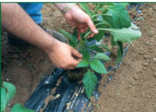
ANTES: Planta sin podar

se haya consolidado el fruto del nudo. Si el fruto ha sido expulsado por alguna causa esperaremos a que fructifiquen y cuajen los dos brotes. Una vez cuajados los dos brotes se procederá al pinzado del que no hace de guía.