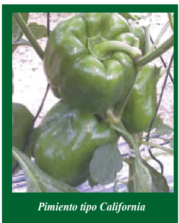
Pimiento tipo California