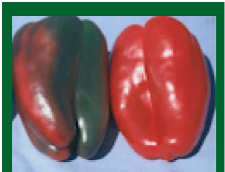
Pimiento tipo Lamuyo