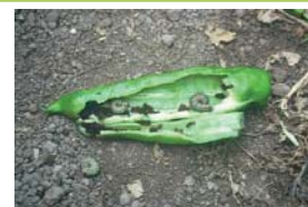
Orugas en pimiento Dulce italiano.

nes, lo que no significa que descuidemos otras plagas o síntomas de alguna enfermedad que pudiera presentarse.