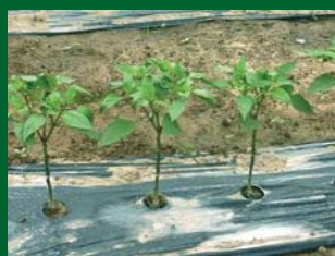
DESPUÉS: Misma planta podada.

Imagen superior, eliminando brotes del tallo principal, y plantas de pimiento con tallo principal limpio de brotes