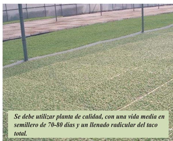
Se debe utilizar planta de calidad, con una vida media en semillero de 70-80 días y un llenado radicular del taco total.

Atendiendo estas cualidades de la planta recomendamos hacer líneas pareadas, separadas 70-80 cm entre sí y pasillos de 120 cm. Esto nos facilitará la poda, el tutorado y la recolección.