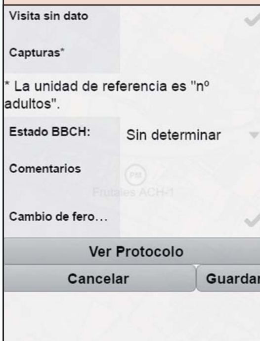
Ventana de introducción de dato de captura y visualización del protocolo de control