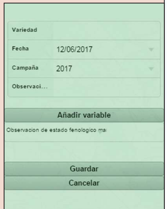
Introducción de datos de nuevas observaciones en campo