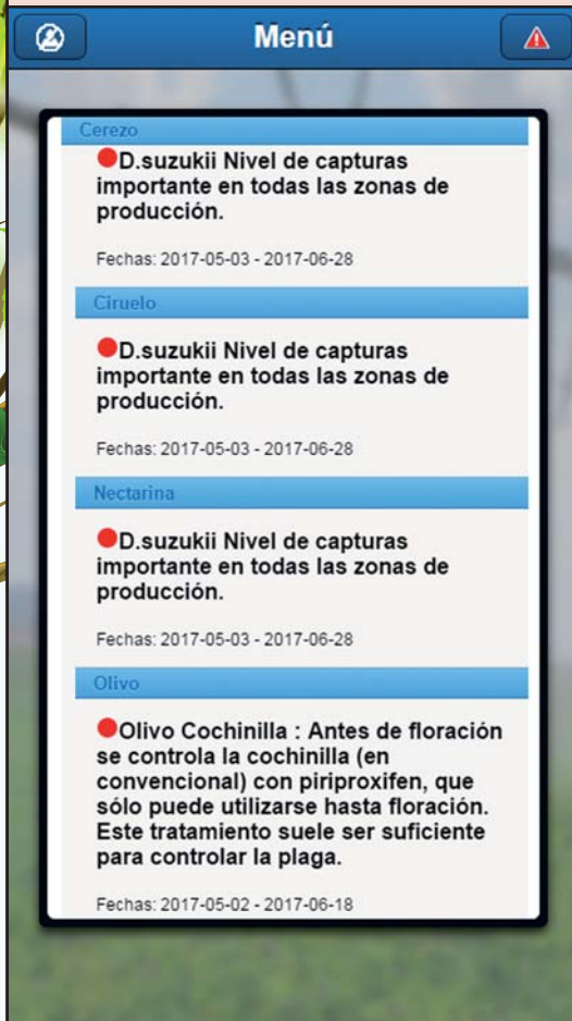
Visualización de avisos activos