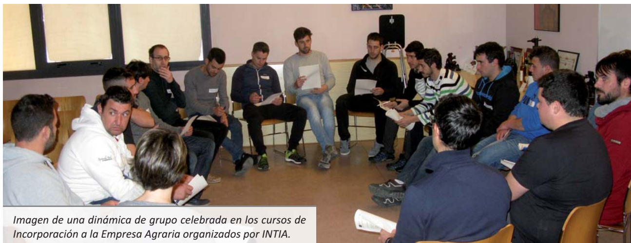
Imagen de una dinámica de grupo celebrada en los cursos de Incorporación a la Empresa Agraria organizados por INTIA.