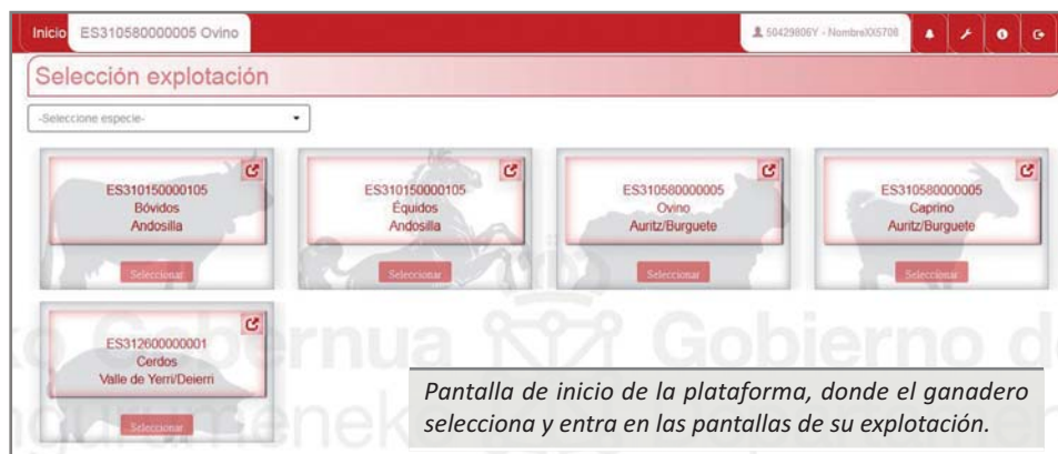
Pantalla de inicio de la plataforma, donde el ganadero selecciona y entra en las pantallas de su explotación.

Se evitan esperas y desplazamientos ahorrando en combustible, se disminuyen los tiempos de gestión para todos, menor coste, máxima comodidad y cercanía ya que se puede acceder a la oficina virtual desde cualquier punto con conexión a Internet en cualquier momento del día o de la noche, etc. En definitiva se favorecen las comunicaciones entre la administración pública y los ganaderos.