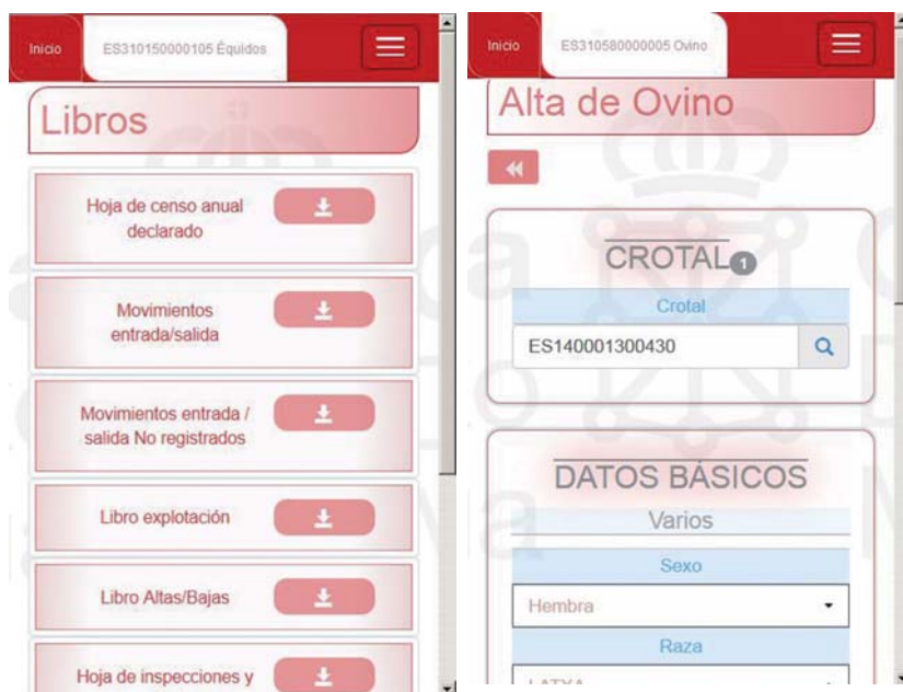
Pantallas de Libro de explotación y para dar de alta al ovino, vistas desde el móvil.