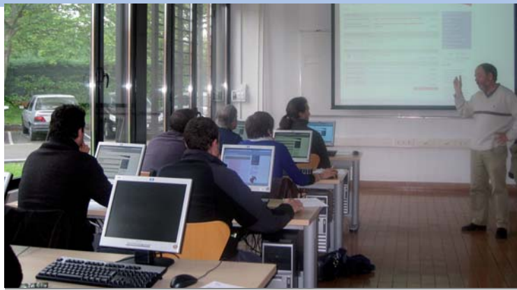
Talleres de formación de la Oficina Virtual Ganadera impartidos en distintas localidades y zonas de Navarra.