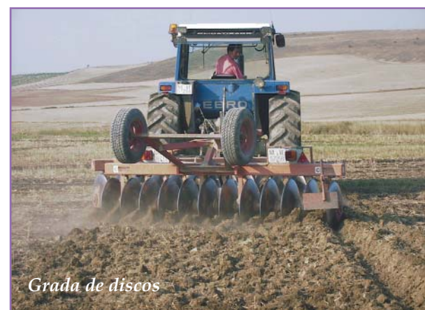
Grada de discos