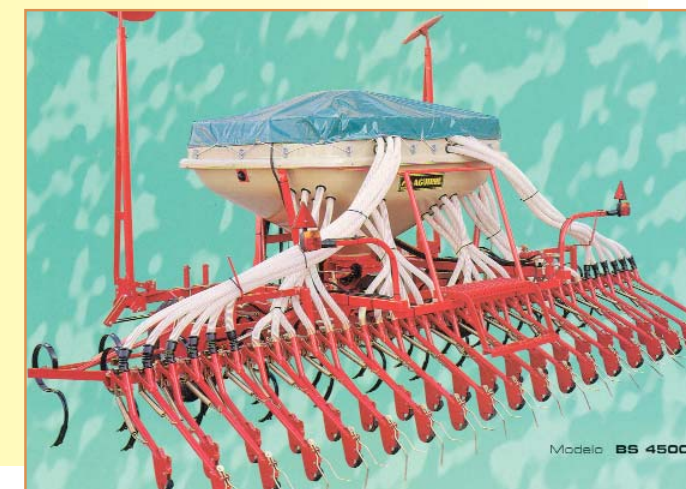
Modelo BS 4500