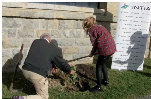
En esta revista se informa sobre algunos de esos hitos.

Navarra Agraria. La jornada continuó con un encuentro que sirvió para recordar a las personas que habían formado parte de la historia de INTIA, para reconocer el trabajo desempeñado desde las distintas áreas en este tiempo y para poner en valor el recorrido realizado de manera conjunta a lo largo de este tiempo. La celebración terminó con un brindis y la foto de familia, con el deseo de volver a conmemorar y celebrar más hitos en la trayectoria de esta sociedad pública.