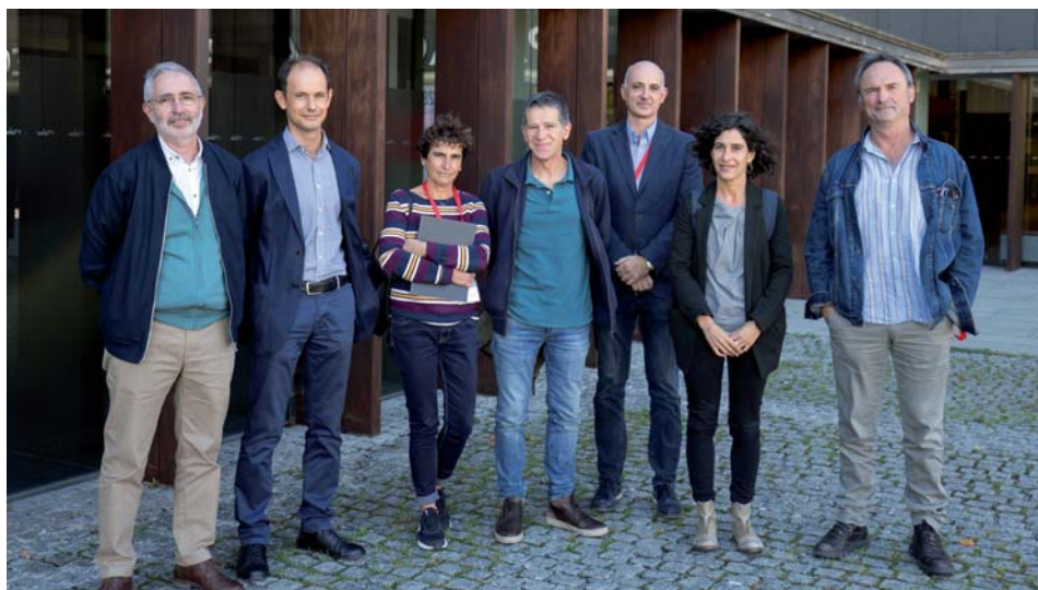
En la imagen superior, momento de la Jornada conmemorativa de los 10 años de INTIA.