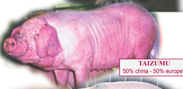
TAIZUMU 50% china - 50% europea