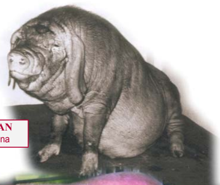
MEISHAN 100% china

P ese a la alta prolificidad, las camadas son bastante homogéneas y los lechones vigorosos. Esto, unido al carácter más tranquilo y maternal de la cerda , permite al ganadero poder destetar un alto porcentaje de los lechones nacidos sin que el número de lechones "rehusados" sea importante.