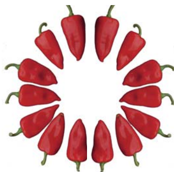
Tabla 1. Resultados de producción de las variedades de pimiento tipo California con maduración en rojo