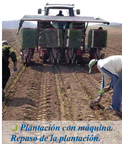
Plantación con máquina. Repaso de la plantación.

La recolección, como ya se ha comentado, sufrió un cierto retraso ya desde el principio. En el ensayo, comenzó el día 9 de noviembre con la variedad Chronos y finalizó el 2 de febrero con las variedades Dyson. En el calendario de recolección (Tabla 2) se puede apreciar, al contrario que en la campaña pasada, el amplísimo periodo de recolección de la mayoría de las variedades. Las dos más precoces (Chronos y Batavia), y las más tardías (Spiridon, Steel y Dyson) han sido las únicas con un periodo de recolección similar al de otros años. En el resto las heladas de final de noviembre y diciembre ralentizaron su recolección, y