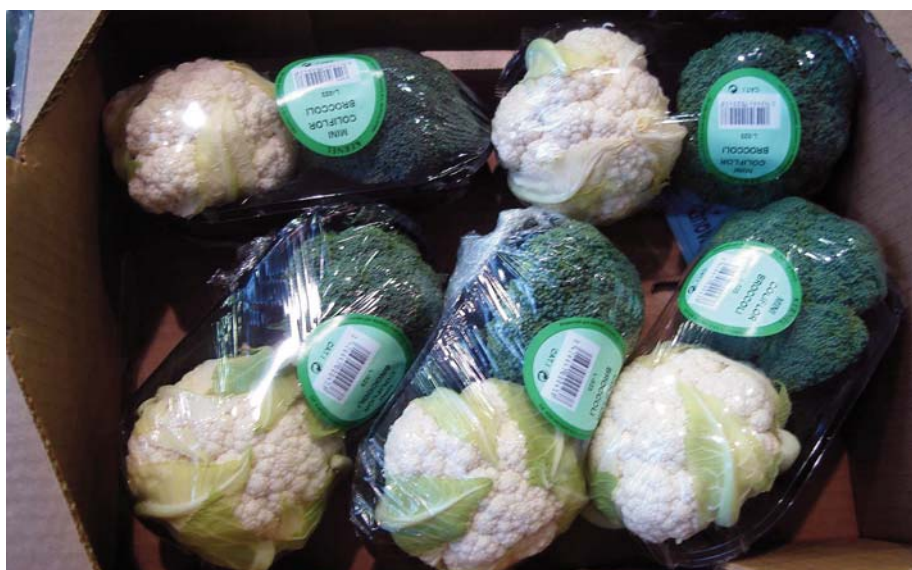
□ Bróculi en bandeja con coliflor. Apto para la distribución y consumo.

El peso medio del conjunto de variedades ha sido de 699 gramos/unidad (Tabla 1) y ha habido ocho variedades con un peso inferior a este valor. Dentro de este grupo Bohr ha alcanzado el valor más bajo, 550 gramos, siendo la única variedad cuyas inflorescencias no han llegado a los 600 gramos. En las otras diez variedades, con un peso superior a la