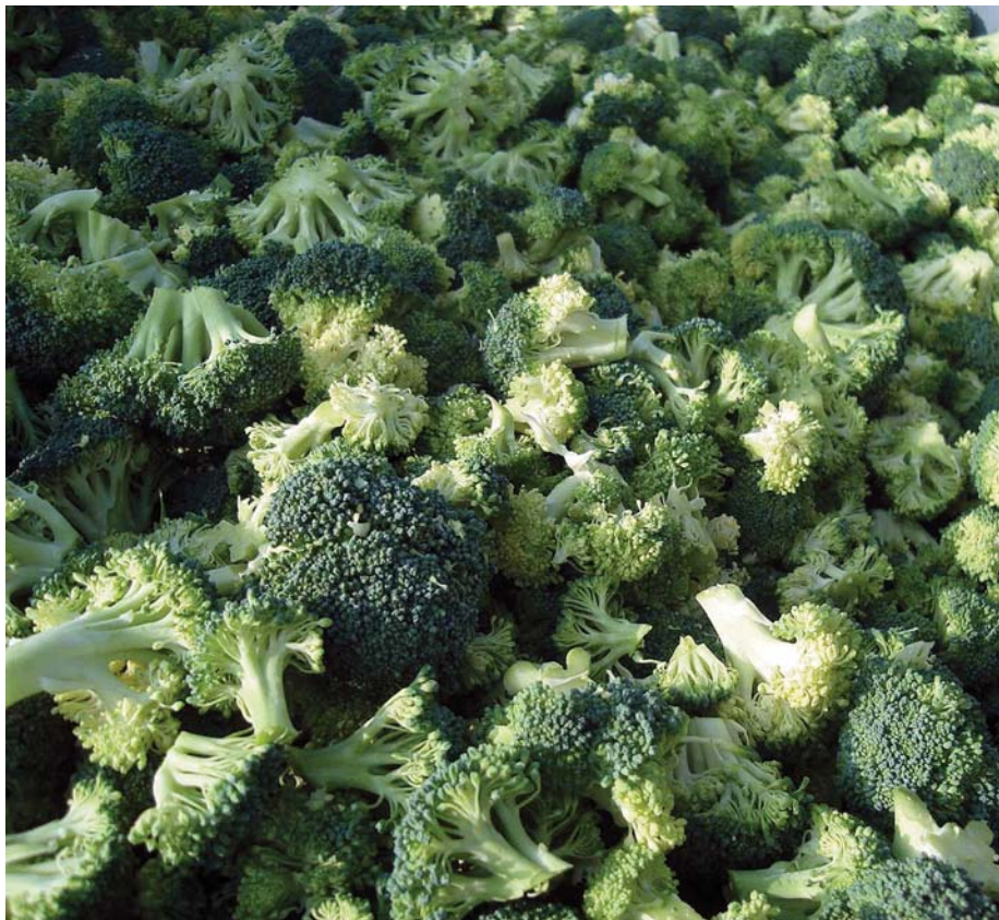
□ Brócoli troceado en la recolección.

En Navarra, en la última década, el brócoli se ha convertido en el cultivo hortícola de mayor progresión y hoy en día, con 4.268 hectáreas, es el cultivo hortícola con mayor superficie de la Comunidad Foral . En los primeros años, la producción obtenida se destinó en su totalidad a las industrias congeladoras, que ya por entonces lo adquirían en otras regiones del país. Luego, a final de la década de los 90 y principios de la década siguiente, años en los cuales aumentó de forma considerable la superficie de