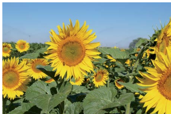
Detalle de plantas de girasol

Las 24 variedades aparecen en las tablas posteriores de datos y resultados del ensayo.