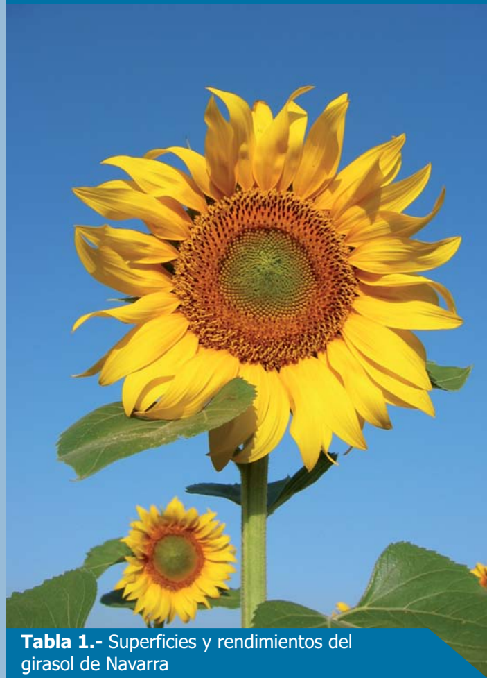
Tabla 1.- Superficies y rendimientos del girasol de Navarra

Los precios de venta, mantienen la tendencia de los últimos años y siguen siendo buenos, parecidos o ligeramente superior a la anterior campaña, quedando alrededor de 410 €/Tonelada.