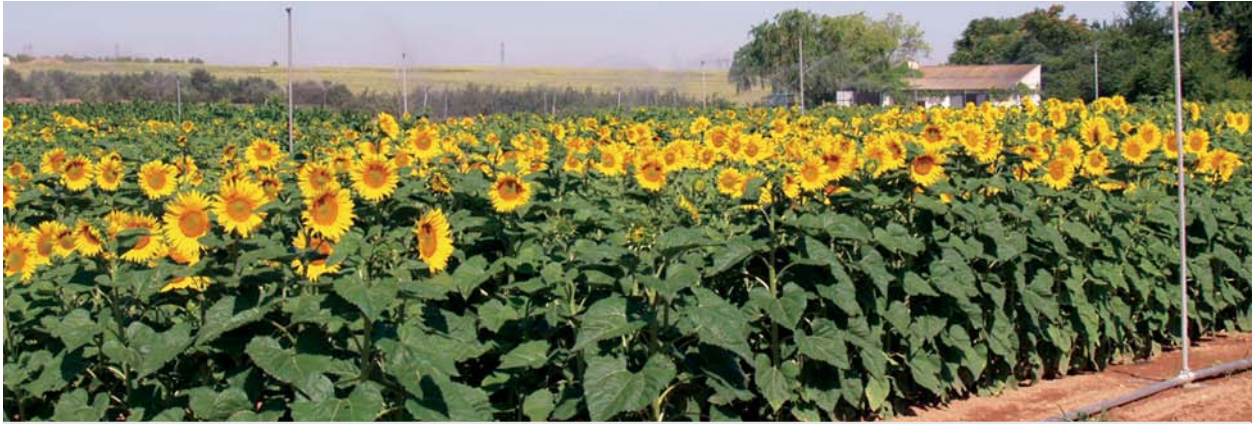
Campo de girasoles