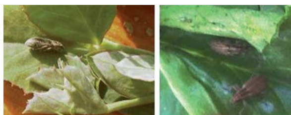
Dos imágenes de sitona. A la izquierda, sitona que se "hace la muerta". A la derecha ejemplares adultos.

Umbral: El tratamiento insecticida está recomendado en el periodo que va desde la nascencia hasta que el cultivo alcance 4-5 hojas. En nuestras condiciones de cultivo generalmente no es necesario realizar intervenciones contra esta plaga. La elección del producto autorizado debe hacerse con el asesoramiento técnico correspondiente.