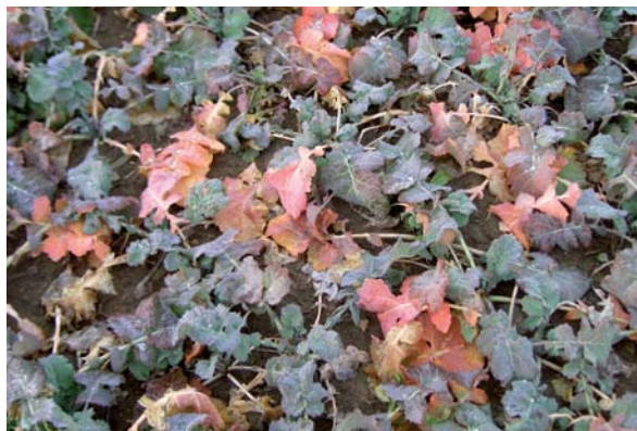
Carencia de Nitrógeno en colza a la salida del invierno. Se debe aportar el N antes que al cereal.

El aporte principal se debe hacer a la salida del invierno, unos días antes que en el caso del cereal, porque el cultivo inicia el tirón vegetativo antes. Si comienza a “pasar hambre” el cultivo se vuelve rojizo como se observa en la foto superior derecha. El primer aporte para la colza debe ser unos 10-15 días antes que para el cereal.