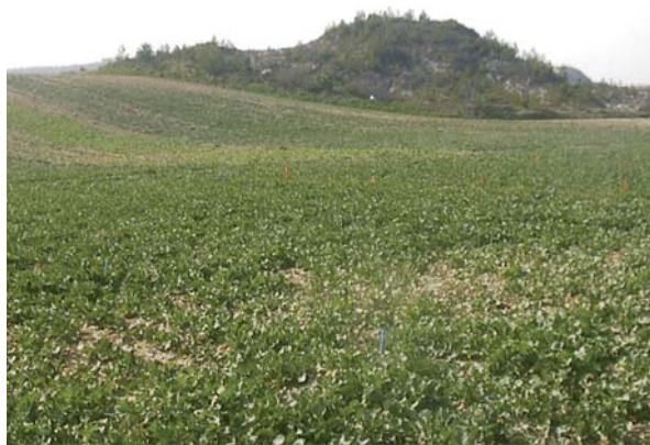
Ensayo de largo plazo de fósforo, parcela testigo.

Al tratarse de un cultivo muy exigente en fósforo, en suelos de fertilidad media, aportaremos en torno a 25 kg de fósforo por tonelada de cosecha esperada , aunque las extracciones son en torno a 10 kg por tonelada. Este exceso de fósforo debe tenerse en cuenta en el balance de los cultivos de la rotación y reducirse en la aportación fertilizante del cultivo siguiente.