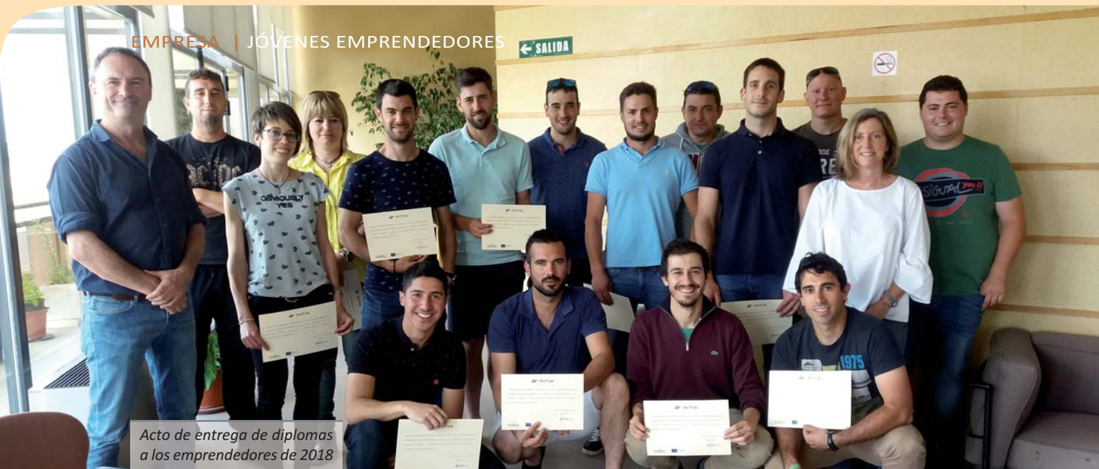
Acto de entrega de diplomas a los emprendedores de 2018

A finales del mes de agosto, un total de 42 jóvenes navarros iniciaron los “Cursos 2018-2019 de Incorporación al Sector Agrario” que desde hace más de 30 años organiza INTIA con carácter anual, 21 de ellos se decantan por la orientación agrícola y otros 21 por la ganadería. Estos cursos están dirigidos específicamente a personas jóvenes que quieren continuar con la explotación familiar o bien emprender en el medio rural en una actividad relacionada con el sector primario. Son el primer peldaño del Programa, más amplio, de “Iniciación en las actividades agrarias” de esta empresa pública que, con el apoyo del Gobierno de Navarra, pone una serie de herramientas a disposición de los emprendedores para ayudarles en su puesta en marcha, desde la “Ventanilla única” al Acompañamiento personalizado.