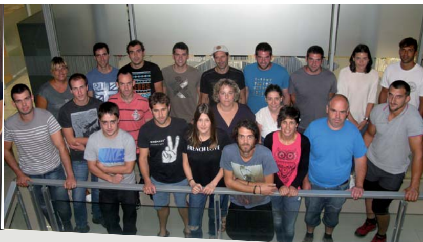
Alumnos de las ramas agrícola y ganadera que han iniciado el Curso de Incorporación 2018-2019