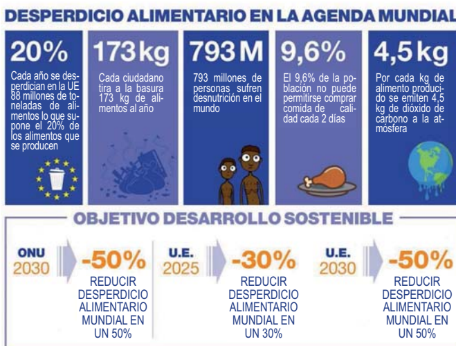
Gráfico 1. Datos del desperdicio alimentario a nivel mundial y objetivos de desarrollo sostenible

El Ministerio de Agricultura, Pesca y Alimentación de España presentó en 2013 la “Estrategia ‘Mas alimento menos desperdicio’”, programa para la reducción de las pérdidas y el desperdicio alimentario y la valorización de los alimentos desechados”. Se trata de una iniciativa para limitar las pérdidas y el desperdicio de alimentos y su impacto sobre el medio ambiente. En la Tabla 1 se muestran las estimaciones de la cantidad de alimentos que se desperdician.