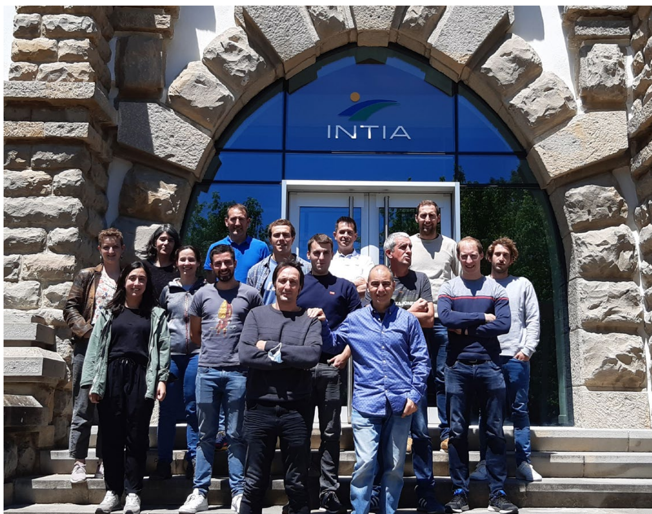
Curso de formación en innovación interactiva y trabajo en red en INTIA. Asistentes.

Algunas de estas herramientas tratan con las diferentes etapas de los procesos, encontrando cuál requiere más atención, los diferentes agentes que deben intervenir y si es necesaria la incorporación de alguno de ellos. Hablan de la estructura que debe tomar la red de trabajo y del papel que debe interpretar cada agente. También es importante aprender de lo realizado, tanto