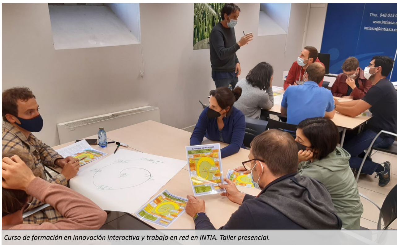
Curso de formación en innovación interactiva y trabajo en red en INTIA. Taller presencial.

de lo que funcionó como de los errores, y para ello se utiliza una herramienta denominada “línea del tiempo”.