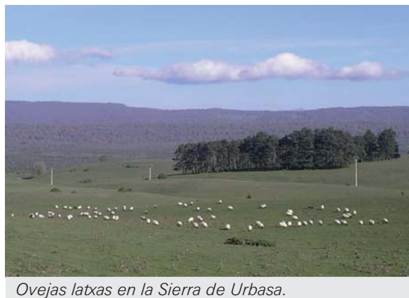
Ovejas latxas en la Sierra de Urbasa.

Una vez madurado el queso (mínimo 2 meses), se tomaron dos muestras de queso por elaboración correspondientes a la fecha de toma de muestras de leche en los meses de febrero, marzo, abril y mayo. Una de las muestras se destinó a la determinación de la composición físico-química y la otra a la determinación del perfil de ácidos grasos.