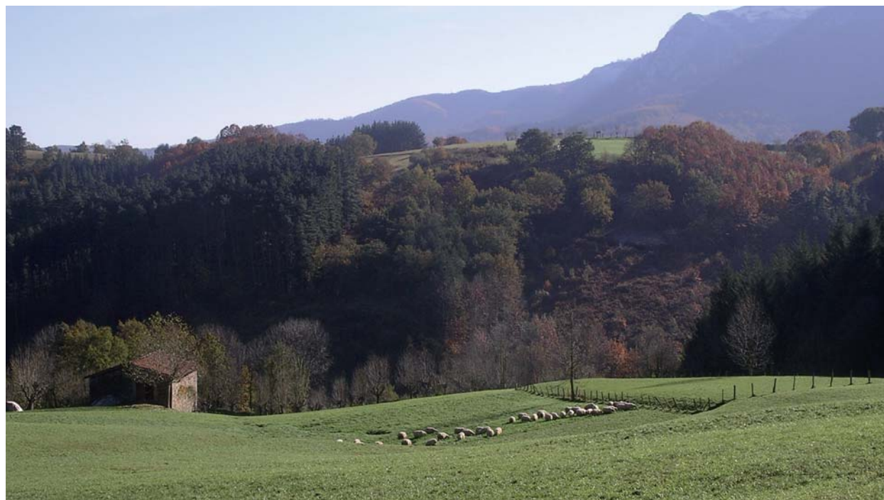
Queda comprobado que una alimentación natural en prados de montaña, como la que se proporciona a las ovejas latxas del País Vasco y Navarra, influye positivamente en la calidad de la leche y el queso que producen.

En cambio, no se ha observado un claro efecto del sistema de manejo en general sobre la calidad de la leche y el queso de oveja de raza Latxa,