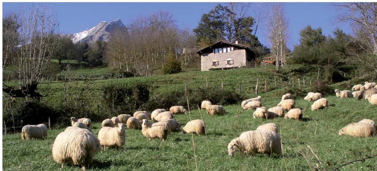
Al comienzo de la primavera se inicia el pastoreo de las ovejas en praderas del valle o la montaña.

En Navarra confluyen distintos tipos de manejo del rebaño de ovejas en producción durante la época de ordeño. Los técnicos de INTIA hemos identificado tres grupos de explotaciones en función del manejo de la alimentación durante el periodo de ordeño, basándonos principalmente en el aprovechamiento o no de pastos durante la época de ordeño.