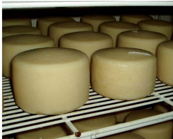
El Instituto Lactológico de Lekunberri realizó los análisis de composición físico-química de las muestras de leche y queso.

Tanto para la leche como para el queso las diferencias observadas entre sistemas en el perfil de ácidos grasos han sido mínimas. En el caso de la leche el sistema de producción sólo afectó significativamente ( P < 0,05 ) al contenido en Omega 6 y la relación Omega 6/Omega 3. En el queso se han observado diferencias significativas entre sistemas para los ácidos grasos omega-3 (n3), total CLA y la relación omega-6/omega-3 (n6/n3). El menor contenido en omega-6 de la leche procedente de rebaños en ecológico así como el mayor contenido en omega-3 observado en el queso puede explicarse