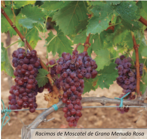
Racimos de Moscatel de Grano Menudo Rosa

representado mayoritariamente por el Moscatel Ottonel y moscateles obtenidos de sus cruces; y un quinto grupo formado por aquellos moscateles rosados o similares.