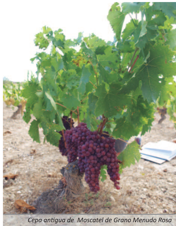
Cepa antigua de Moscatel de Grano Menudo Rosa

La metodología llevada a cabo en el trabajo de recopilación efectuado desde EVENA es simple pero rigurosa. Básicamente consiste en la localización, en los viñedos más antiguos de los municipios de Corella, Bargota y Los Arcos (ver Tabla 1 ), de aquellos cepajes de Moscatel de color y su marcaje en campo, para una vez recogida la madera, multiplicarla vegetativamente mediante la realización de planta-injerto en cantidad suficiente como para nutrir el conservatorio de cepas ubicado Olite.