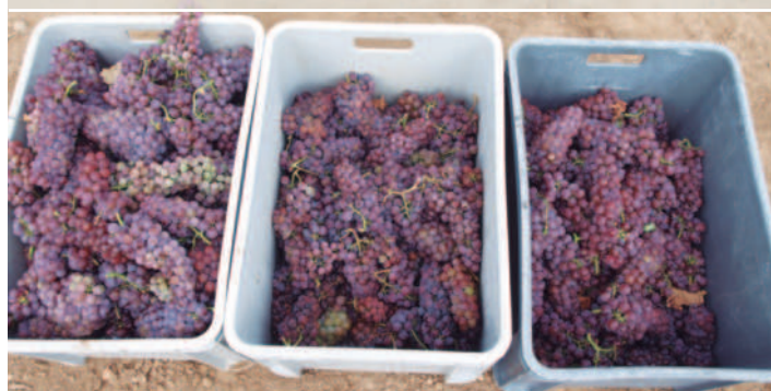
Vendimia de los biotipos: Bargota, Los Arcos y Corella, respectivamente

En la Tabla 3, se muestran los parámetros correspondientes a la vendimia 2016 de los tres biotipos recopilados y situados en la finca de conservación del Extremal. En los resultados se puede observar un comportamiento diferente entre biotipos. Diferencias destacables en cuanto al peso del racimo, peso de la baya y el grado alcohólico probable.