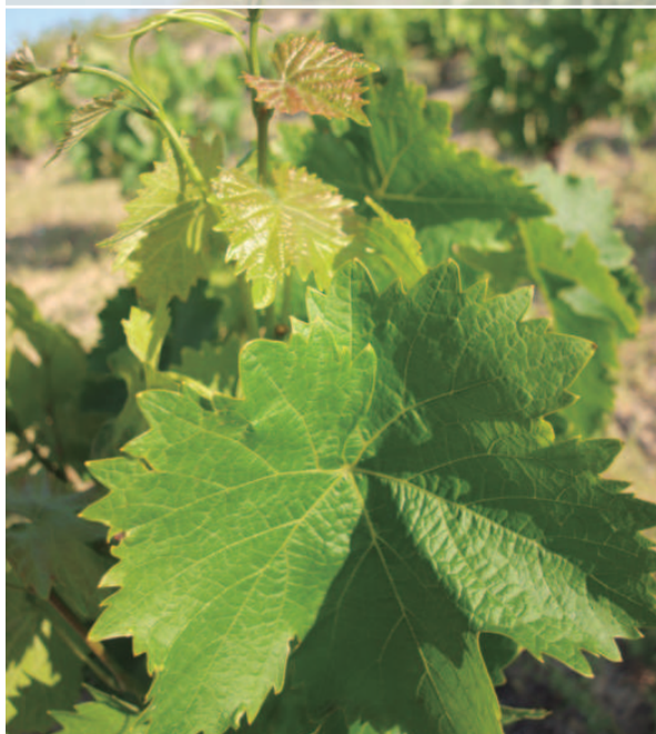
Detalle del ápice y de la hoja de Moscatel de Grano Menudo Rosa

En la numerosa familia del Moscatel (más de 200 cultivares), existen viñedos que derivan tanto del cruzamiento espontáneo o artificial como de mutaciones de yemas. Entre ellos se diferencian por caracteres ampelográficos evidentes como el tamaño de racimo y baya (Moscatel de Alejandría y Moscatel de Grano Menudo), o por el color de baya (Moscatel rosado y el morado), y también por la cantidad de aromas terpénicos.