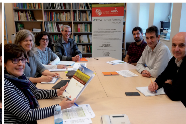
En la imagen izquierda, taller de teledetección y maquinaria inteligente, dirigido por personal experto de INTIA. En la imagen derecha, miembros del equipo de trabajo del proyecto Smart Akis en INTIA.