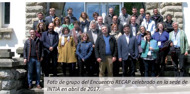
Foto de grupo del Encuentro RECAP celebrado en la sede de INTIA en abril de 2017.

RECAP ofrecerá a los profesionales de la agricultura una herramienta de apoyo para el cumplimiento de la normativa de la PAC , proveyéndoles de información personalizada para simplificar la interpretación de esta compleja legislación así como de alertas de potenciales incumplimientos.