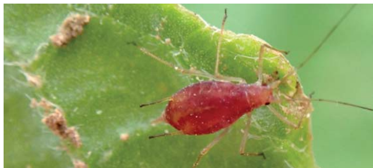
■ Extensivos de verano

En el periodo mencionado se han controlado un total de 231 puntos de monitoreo (trampas) , lo que ha supuesto un incremento de 36 puntos con respecto a la campaña pasada (ver Tabla 1 ). Se han aumentado tanto los puntos destinados al cultivo del maíz llegando a las zonas de producción más al norte, como las trampas para el control de los cultivos de hortalizas, fundamentalmente tomate de industria, que en las últimas campañas viene ampliando sus zonas de producción. El seguimiento de la mosca del olivo ( Bactrocera olea ), plaga en la que se ha observado un incremento de la incidencia en aceitunas de almazara, también se ha ampliado con nuevos puntos en las zonas de Cáseda y Oteiza.