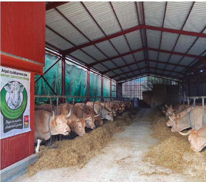
Pasillo de alimentación. Explotación de Gil Goyeneche de Arizkun

la ubicación y el entorno de la ganadería, con el diseño y la construcción de las instalaciones, su mantenimiento, condiciones ambientales e iluminación, metros cuadrados disponibles por animal, etc.