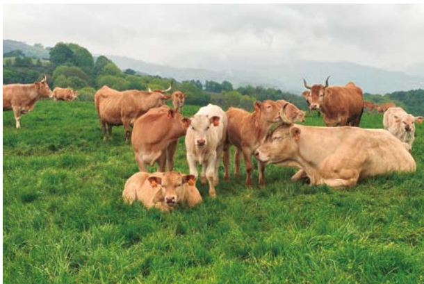
Aprovechamiento de recursos naturales

En este principio se revisan 16 requisitos relacionados con