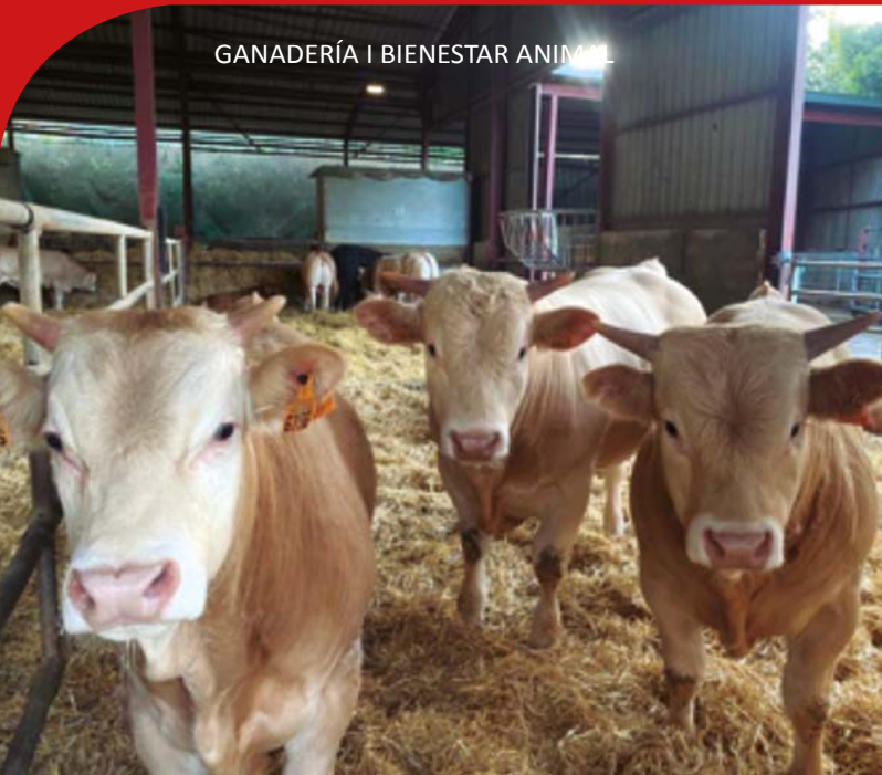
Reacción positiva frente al ganadero