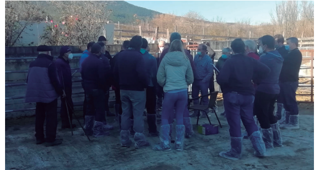
Imágenes de la Jornada demostrativa de explotación piloto.

sea a cebadero, en el caso de los pasteros, bien sea con destino a matadero. Otra de las ventajas es que abarata el sistema de recogida de datos, reduciendo los gastos de la asociación haciendo todo más sostenible (menos desplazamientos, combustible, mano de obra, etc.) gastos que pueden ser muy útiles en otros capítulos. Por último, involucra más directamente a la persona responsable de la explotación con su programa de cría, con su programa de mejora y por tanto se le hace más protagonista y partícipe de la evolución de su raza.