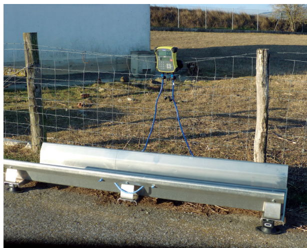
Báscula de Autopesaje.

También se han adaptado los sistemas de recogida de datos de ASPINA. La empresa proveedora de las básculas se ha encargado de programar la recogida de datos y de formar a ASPINA en su uso.