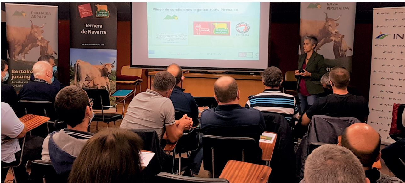
Presentación del logotipo '100% Raza Autóctona Pirenaica' en Elizondo.

Este sello '100 % Raza autóctona' está promovido por el Ministerio de Agricultura Pesca y Alimentación (MAPA), y se trata de una herramienta para que las asociaciones de raza pura puedan añadir el nombre de la raza a los productos, en este caso carne, que se obtienen de los animales con una determinada pureza racial.