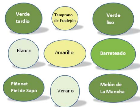
Dibujo 1. Variedades ensayadas.

Como puede observarse, hay plantas con frutos de diverso tipo. En todos los resultados del ensayo, las variedades se agruparon según los mismos.