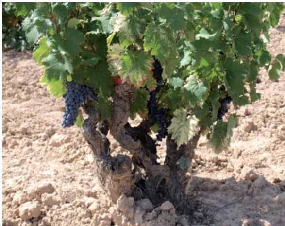
Monastrel, cepa de cultivo ancestral en el valle del Ebro.