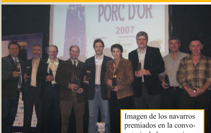
Imagen de los navarras premiados en la convocatoria de los premios Porc d'Or del año 2007.

ITG Ganadero agradece desde esta revista el patrocinio a las empresas navarras afines al sector: Caja Rural de Navarra, Complementos de Piensos Compuestos (COPICO), Piensos SAI OA e Industrias SUESCUN, que con su colaboración hacen posible este acto.